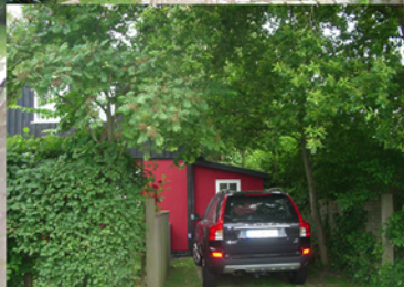
St. PETER-ORDING WALDALLEE 11